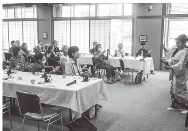
一人暮らし高齢者集合昼食会