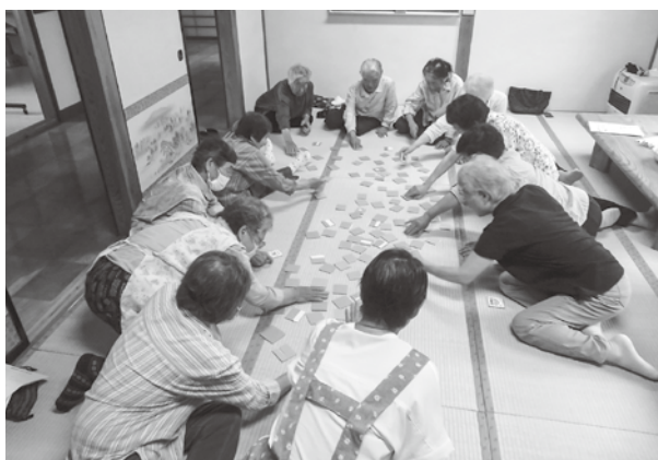
いきいきサロン（カードゲーム）